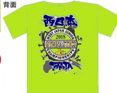
D⑨ライトグリーン 背面